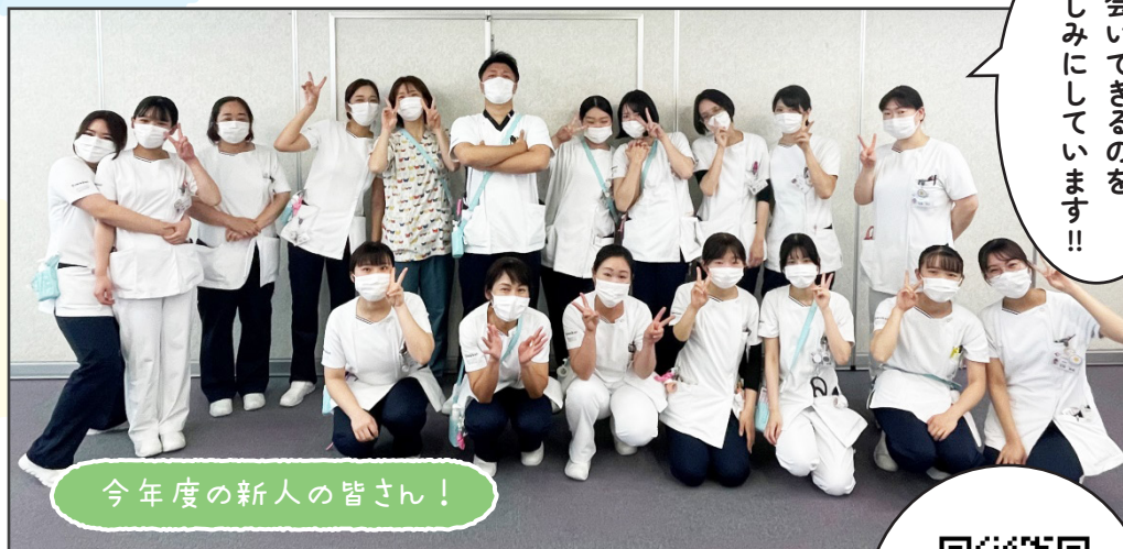
今年度の新人の皆さん！