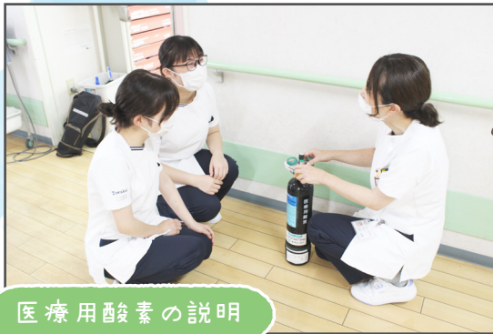
医療用酸素の説明