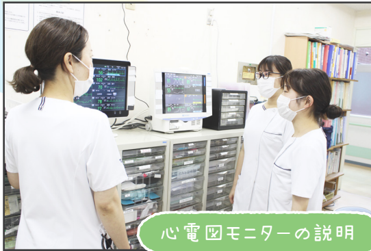
心電図モニターの説明