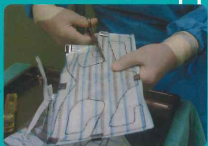
TVM手術で埋め込む合成メッシュの 形を調整する様子

日本泌尿器科学会認定 泌尿器科専門医 日本骨盤臓器脱手術学会 理事長 日本女性骨盤底医学会 理事